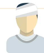
Nog steeds ziek

Werknemer ontvangt bij einde dienstverband van werkgever re-integratieverslag. Dit verslag is door UWV en gemeente bij werkgever op te vragen.