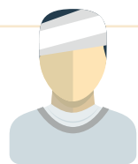
Ziek uit dienst

Werknemer vraagt via werkgever Ziektewetuitkering aan.